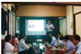
大淀地区県政報告会