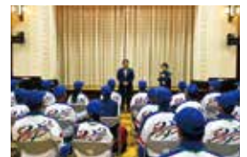
全国障がい者スポーツ大会 結団式