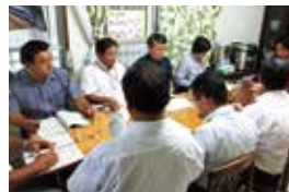
沖縄県 子ども食堂視察