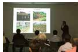
清武地区県政報告会