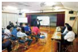
細江地区 県政報告