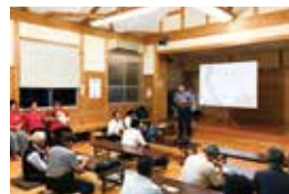
木花地区 県政報告会