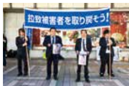
拉致被害者救済活動