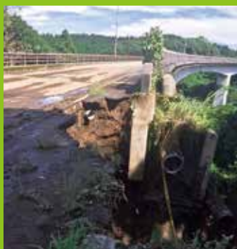
田野町 河鹿大橋決壊

目まぐるしく動く世界また社会情勢の中、今後も県政がもっともっと皆様方に分かりやすく近くに感じられるよう務めて参ります。初心を忘れず、感謝を忘れず、重責感と緊張感を忘れず、皆様方の近くで気さくにフットワークよく、皆様方の思いや要望等が一つでも少しでも形になるようふるさと宮崎の発展の為に全力で活動して参ります。