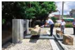
沖縄県 ひむかいの塔 献花