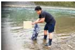
モクスカニの放流