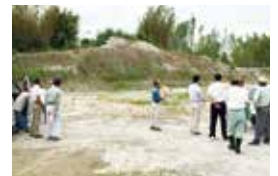
古城地区 急傾斜地現場確認